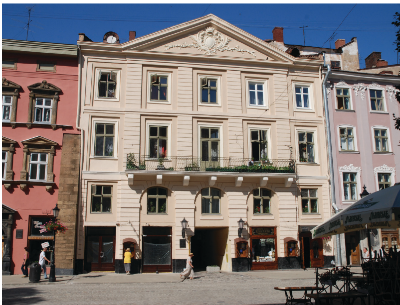
Кам'яниця Андреоллі на пл. Ринок, 29. Сучасне фото

25.09.1808. Під час наполеонівських воєн видав два пастирські послання до вірних, у яких закликав зберігати вірність австрійському престолу. Мав велику бібліотеку (8 тис. томів), яку передав капітулі. Негативно ставився до польського визвольного руху, а 1809 через польські погрози вимушено покинув Львів. За інформацію про його перебування польська тимчасова адміністрація Галичини встановила грошову винагороду – 5 тис. золотих ринських. В околицях м. Стрия митрополита затримали і відправили до стрийського польського окружного управління. Після відновлення австрійської адміністрації А. повернувся до Львова. Помер у Львові від скарлатини, був похований на Городоцькому цвинтарі . У сер. 1860-х сліди могили загубилися. 1897 поховання А. нібито було віднайдене. Однак спроби ідентифікувати останки А. виявилися марними. З ліквідацією наприкін. XIX ст. Городоцького цвинтаря місце поховання митрополита безслідно зникло.