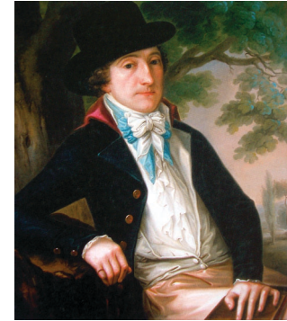
Ю. Рейхан. Портрет Войцеха Богуславського. 1790-ті рр.

АНГЕЛОВИЧ АНТІН (1756–09.08.1814) – український культурний і церковний діяч. Брат Андрія Ангеловича . Народився в с. Гринів (тепер Пустомитівського р-ну Львівської обл.) у родині священника. Освіту здобув у Львівській єзуїтській академії та Віденській греко-католицькій семінарії св. Варвари. Після висвячення (1783) був ректором (1783–1784) Львівської генеральної семінарії. Згодом очолював кафедру догматики (1784–1787) у Львівському університеті та знову семінарію (1787–1795). 1792–1795 – член університетського Консесу від богословського факультету. Був одночасно перемиським (від 1795), львівським (з 1798) і холмським (1804) єпископом. З відновленням Галицької митрополії (17.04.1807) іменований її митрополитом: урочисте обняття престолу відбулося