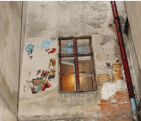
Фрагменти стінопису у пасажі Андреоллі. Сучасне фото