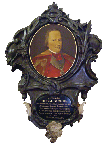
Антін Ангелович. Портрет у картуші. Собор св. Юра. XIX ст.